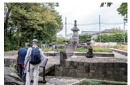
茶々姫の墓・本門寺最大の墓