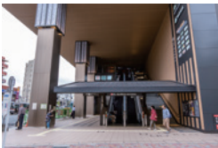
東急池上線 池上駅前集合