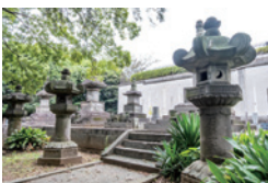
紀州徳川家の墓所・お万の方 他