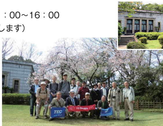
渋沢史料館の前で平成25年の飛鳥山ウォーク