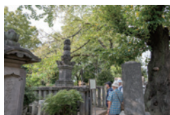
加藤清正の供養塔