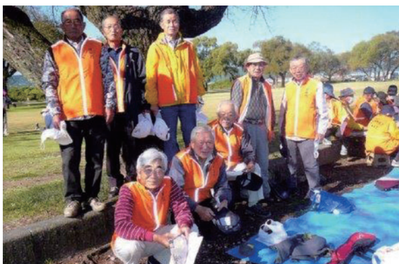
令和3年 静岡県シ連グラウンドゴルフ大会 出場記念 R3,10,28 (木)

二つのゴルフを楽しんではいるが、コロナが収束し、定年後始めたハイキングや旅行が楽しめる日が来るのを願うばかりである。