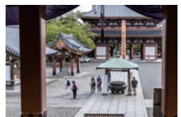
大堂より仁王門を望む

◎次回は令和4年3月31日（木）「飛鳥山公園さくらウォーキング」を予定しています。