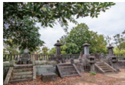
加賀前田家の墓所