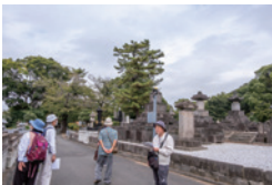
徳川家の関係者の墓所