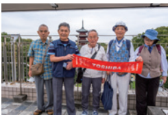
池上会館屋上で昼食