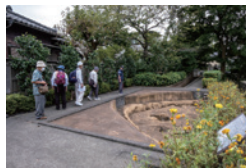
万両塚周辺調査中に古墳が出土