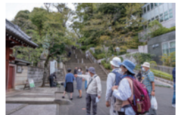
理境院と此経難持坂