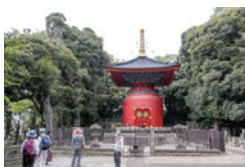
多宝塔・日蓮聖人が茶毘にふされた所