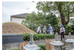
堤方権現台古墳横にて