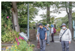
万両塚（鳥取藩池田家）へ