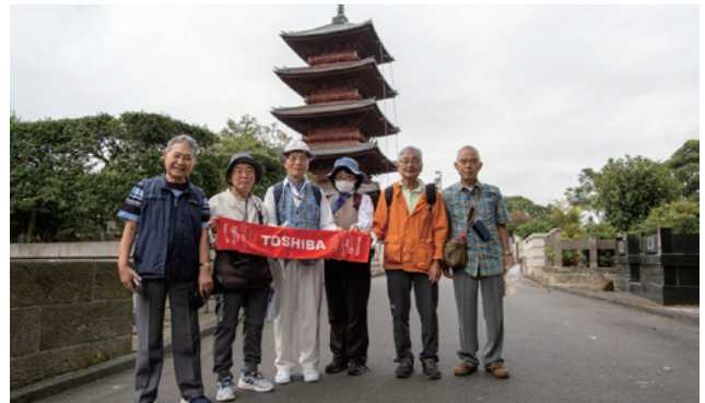
五重塔前にて 秀忠が建立・関東に残る最古の五重塔