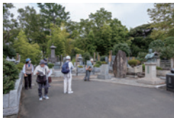
力道山の墓の前にて