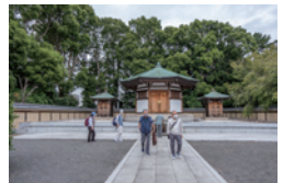
日蓮大聖人御廟所