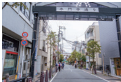
太門寺通りを進む