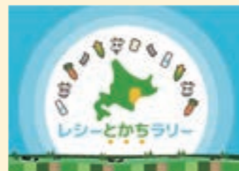
「レシーとかちラリー」ロゴ

本プロジェクトを通じ、十勝に暮らす方々にとっての買物利便性の向上、および経済活性化を目的とし、期間中1万人の参加を目指します。