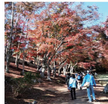
丁度紅葉のピークの様です

令和元年11月30日（土）ふれあいウォーキングを行いました。修善寺自然公園モミジ林までのウォーキングです。1週間降り続いた雨も上がって当日は晴天となりました。