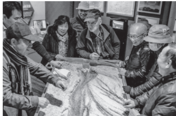
ジオリアで川のシミュレーションを楽しむ

ウォーキング終了後、伊豆長岡温泉に立ち寄り、ひと風呂浴びてから新年会の宴に移りました。お互いの近況をサカナに、また、のど自慢のカラオケもあり和やかな宴会となりました。