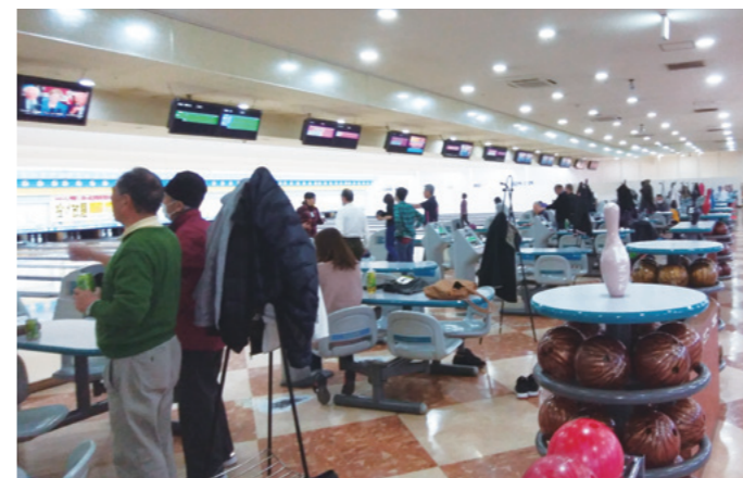
24レーンなのにほぼ埋まっている

5回目で初めてラジオ体操で体をほぐしました。スコアは、やっぱり年々落ちるようですが、それでも1年に1回2Gをこなせるのは元気な証拠です。