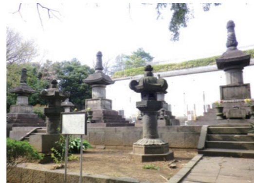
紀伊徳川家の墓所（本門寺最大の墓所）