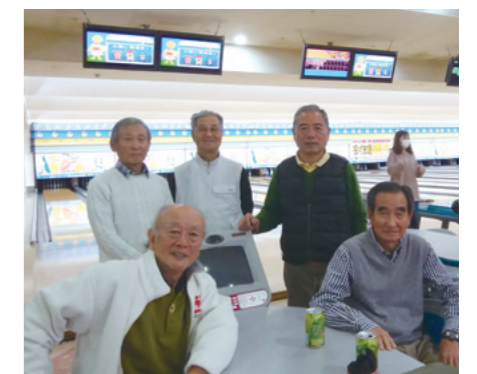
相変わらず元気な面々

5回目で初めてラジオ体操で体をほぐしました。スコアは、やっぱり年々落ちるようですが、それでも1年に1回2Gをこなせるのは元気な証拠です。