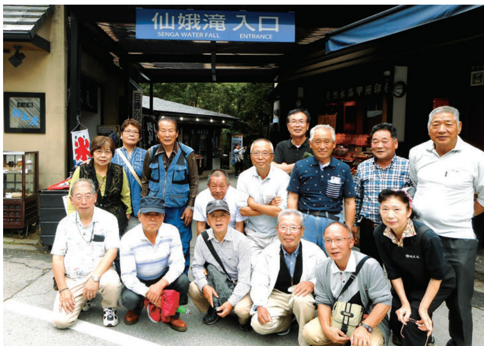
土産物屋にて記念撮影

そこは土産物屋が並んでいて、お店をのぞいたら、残りのメンバーが既に到着していて、昼食はここに決めたと言われた。ここで名物「ほうとう鍋」を注文した。ウィークデーのせいか他にお客はなく貸し切り状態、わきあいあいと舌鼓を打った。お店の人と一緒に記念写真を撮り、全品割引すると言われ、土産物を買った。