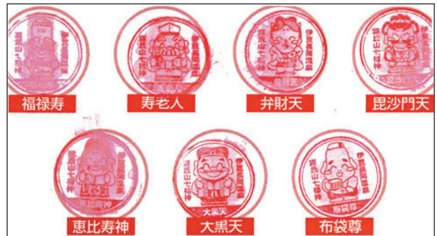
七福神めぐりのスタンプ

卒寿を迎える大先輩も元気に歩いていただきました。温泉街の小路をたどり、旧芸妓学校の長岡見番や北条時頼の五輪塔など、普段目にしない場所を訪ねて、4km ほどのコースを 2 時間ほどかけてワイワイと楽しく歩きました。七福神のご利益を得て、長寿・健康・開運財福・幸福・交通安全・勝利祈願・恋愛がかなうことでしょう。