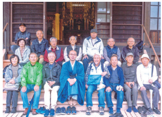
興聖寺住職を囲んで

ウォーキングのゴールである道の駅周辺には、台風19号の浸水被害の爪痕が残り、伊豆半島や、東日本を襲った水害の恐ろしさを追体験しました。新しくできた”めんたいパーク”や川の駅は初めてという会員も多く、函南町の名所を知る良い機会となりました。