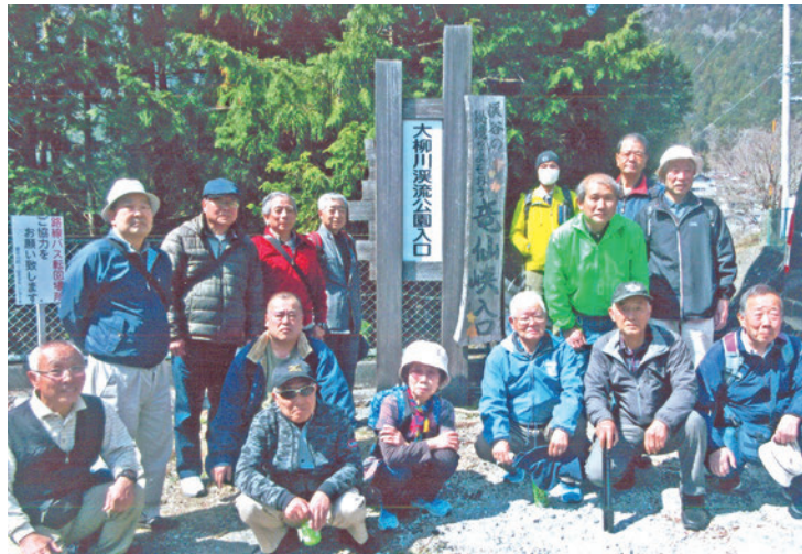
大柳川公園から“さあスタート”

1kmを2時間で歩く最初の説明・予想とは大きく違い、数十メートルから流れ落ちる滝の水は豪快、それらを取り巻く巨岩・奇岩の間をロープを頼りにつり橋を渡り、さらに滑りやすい木の葉を踏み分け「一步一步・休み休み」無事踏破しました。