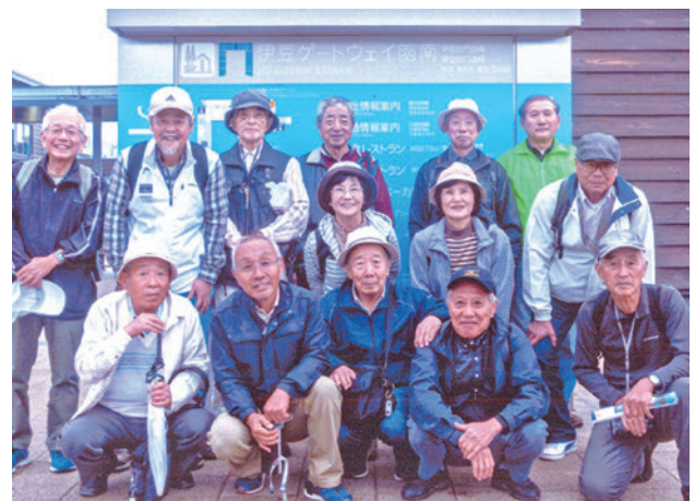
道の駅の看板をバックに