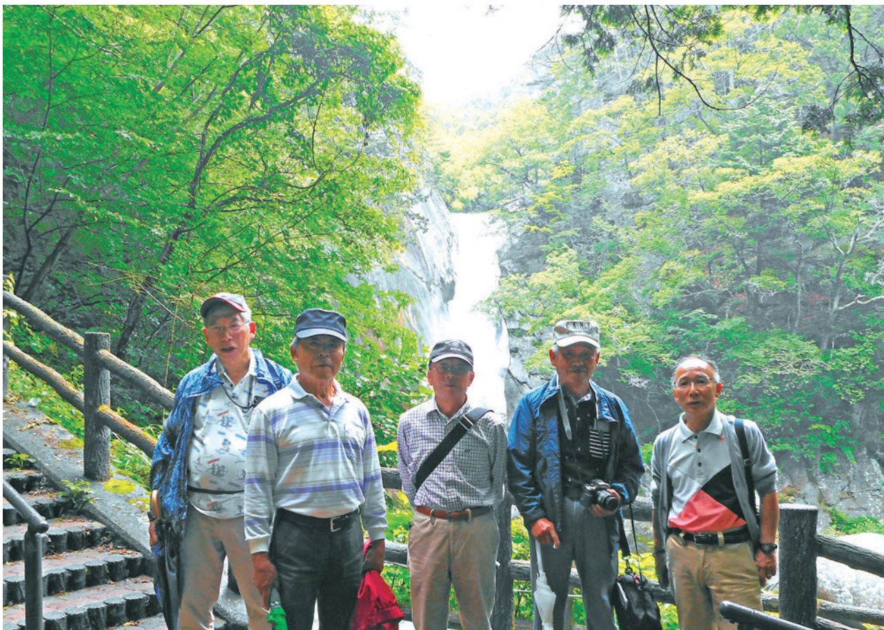
「仙娥滝」にて記念撮影

ウォーキング参加者は 8 名になったが、雨上がりの道を足元に気を付けながら歩いた。途中の仙娥滝は梅雨時期のせいか豪快に水が落ちていた。途中、滝がよく見える所で一同記念写真を撮り、滝の上まで登り出た。