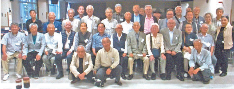
総会後の集合写真

初めて参加された会員も和気あいあいに昔話に花が咲き、酒も弾み、素晴らしい宴でした。会員同士の絆が以前にも増して強く結ばれました。有り難うございました。