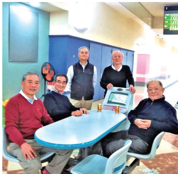
終了後に笑ってご苦労さまでした