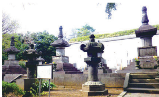
紀伊徳川家の墓所（本門寺最大の墓所）