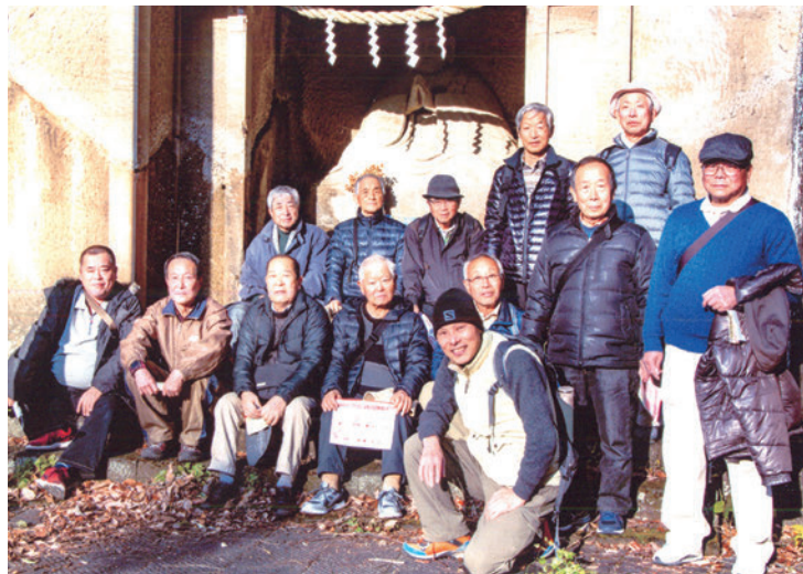
七福神めぐりの途中、あやめ御前の石仏前にて

ウォーキング終了後、伊豆長岡のいつもの立ち寄り湯でひと風呂浴びてから、参加者で新年会の宴に移りました。久しぶりに参加する OB もあり、全員が近況などを紹介しあい、和やかな総会となりました。