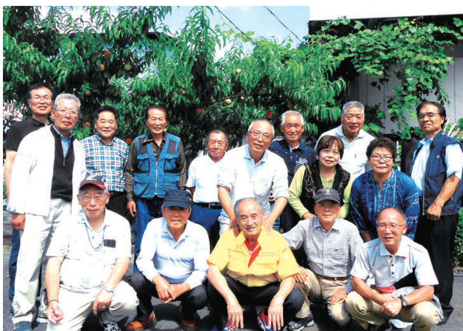
桃農園にて記念撮影

やがて昇仙峡を後にし、桃狩りに向かった。運転手の紹介もあり、御坂峠入り口の桃農園に立ち寄った。店主の口上では、本年は生育の過程でひょうが降り傷物が多い等の話の後、傷物は割引すると言われ買った。最後に店主も入れて桃の木の前で写真を撮った。帰り際、この店主、バスの中まで入ってきて自家製のぶどうジュースを買えば景品に柿ワインを贈呈するとの口上にさらに財布が緩んでしまった。なんだか買い物ツアーになった感じだったが楽しい一日となった。参加した皆さま、お疲れさまでした。