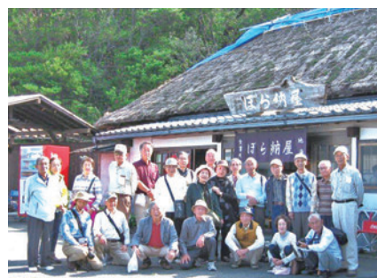
第四弾：東海岸ジオ巡り

さて、この間、時代は平成から令和へと5月～11月にかけて天皇のご即位に始まり皇室の主要行事を消化する中で変遷して参りました。私は昨年末よりどう変化に対応すべきか自問自答してきました。