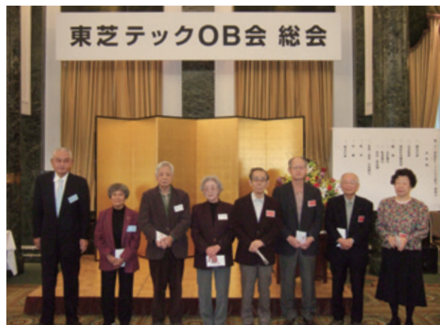
当日出席された米寿・喜寿の方々