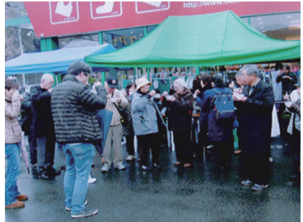
伊勢海老の味噌汁