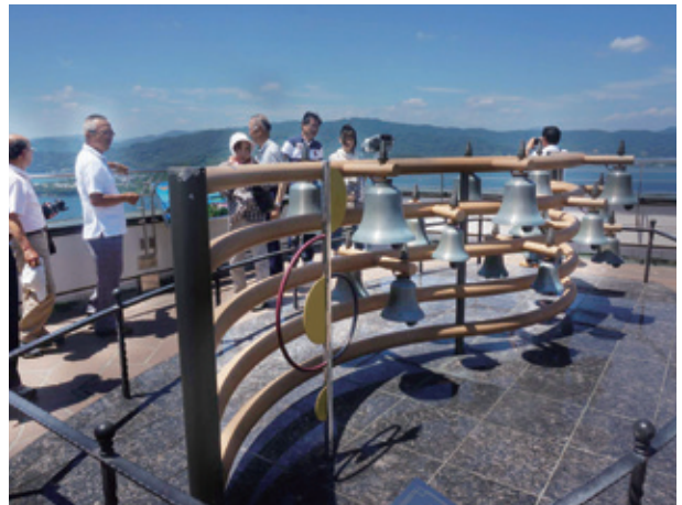
館山寺ロープウェイ展望台