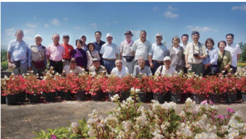
浜松フラワーパーク

バスに戻り、少し乗車し、浜松フラワーパークに入園した。ここでやっと全員の記念写真を撮った。夏の日差しが強く、園内巡回の汽車に乗った。ゆっくりした速度で園内を廻った。最後にうなぎパイの工場見学をし帰宅した。夏の暑さが強烈な一日であったが、楽しい一日であった。