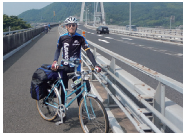
しまなみ海道 生口橋

仕事はジェトロ(日本貿易振興機構)で中小企業のアジアへの進出支援を行っていますが、現役時代の長い海外経験で中小企業社長の海外進出の夢を実現するお手伝いが出来ることを嬉しく思っています。