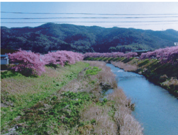
“みなみの桜” 青野川