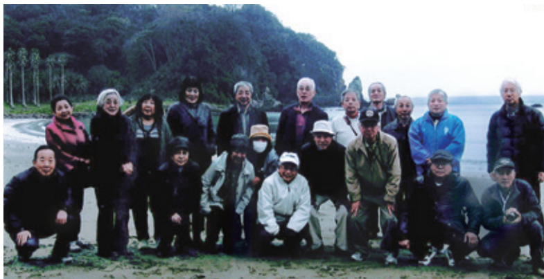
弓ヶ浜にて全員で

三島市役所前 AM8:00 →南伊豆下加茂熱帯植物園→ミロー(伊勢海老の味噌汁)→みなみの桜(昼食) 日野の菜の花畑→弓ヶ浜→バスにて了仙寺・泰平寺・宝福寺・ナマコ壁の家→開国下田港(道の駅) 東京ラスク→三島 PM5:00