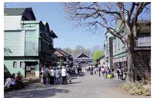
△たてもの園、復元、下町中通り