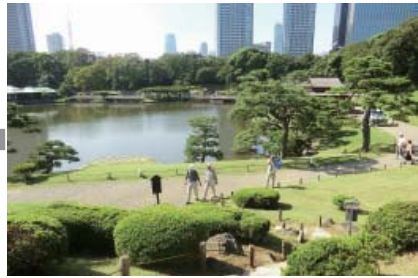
丘の上から潮入の池を望む