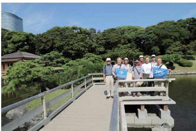
浜離宮恩賜庭園瀬入の池にて