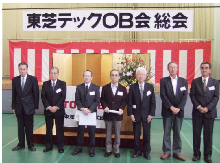
退任される幹事の方々