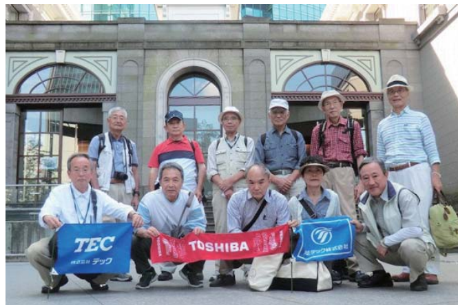
旧新橋停車場・鉄道歴史展示場前にて