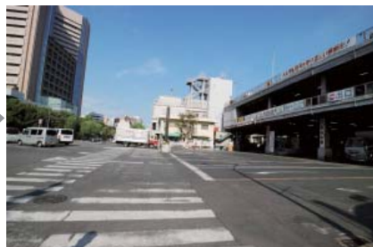
築地の中央卸売市場