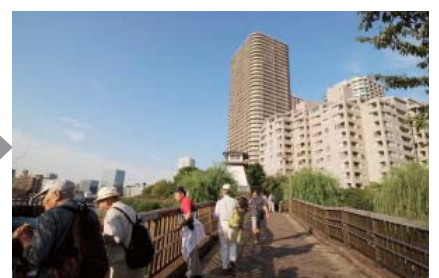
IHI工場跡地に立つマンション群