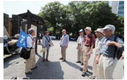
浜離宮大手門入口