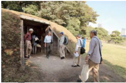
鴨場を見学する参加者