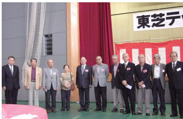
当日出席された喜寿の方々