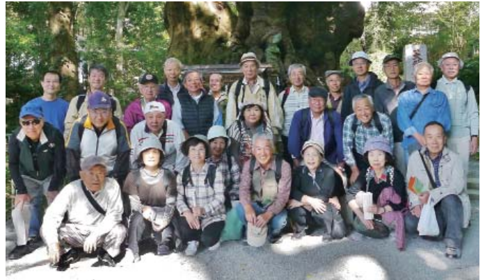
大楠をバックに全員で

夏の暑さを思い起こさせる快晴の平成27年10月27日元気なOB・OG 27名が来宮駅に集合。駅前広場で準備体操してから出発です。来宮神社（パワースポット）でウォーキングの安全を祈り、健康寿命が1年伸びるように大楠を一回り。皆さん余裕あるのか、一回りで済ませていました。集合写真はたまたま通りかかったグループのおばさんをお願いしたら、観光地のプロ写真屋顔負けで注文つけながら撮ってくれた。