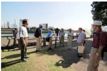
徳川慶喜公お上がり場史跡前にて