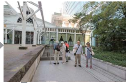
旧新橋停車場のホームとレール