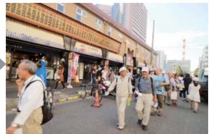
たくさんの店が並ぶ場外市場