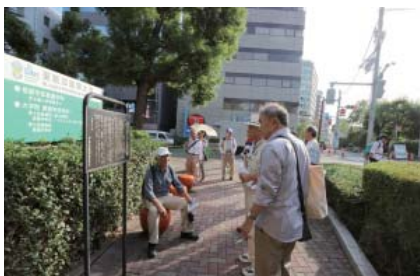
聖路加国際大学・浅野内匠頭邸跡・ 芥川龍之介生誕の地