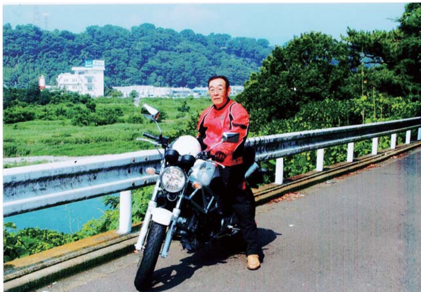
自宅近くの圏央道 相模原愛川インター付近

最後に今、高齢者事故が増大しているなか、更に他人も認める本当のセーフライダーを目指しています。