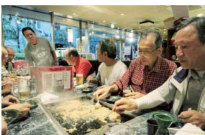
ゴールの月島駅近くで名物の“もんじゃ”で仕上げ