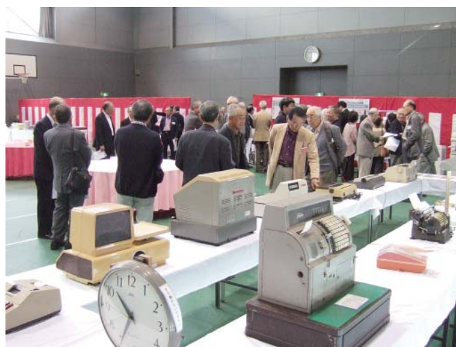
兼高さん提供の製品展示