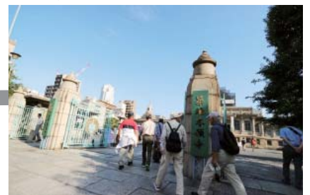
築地本願寺に入る参加者