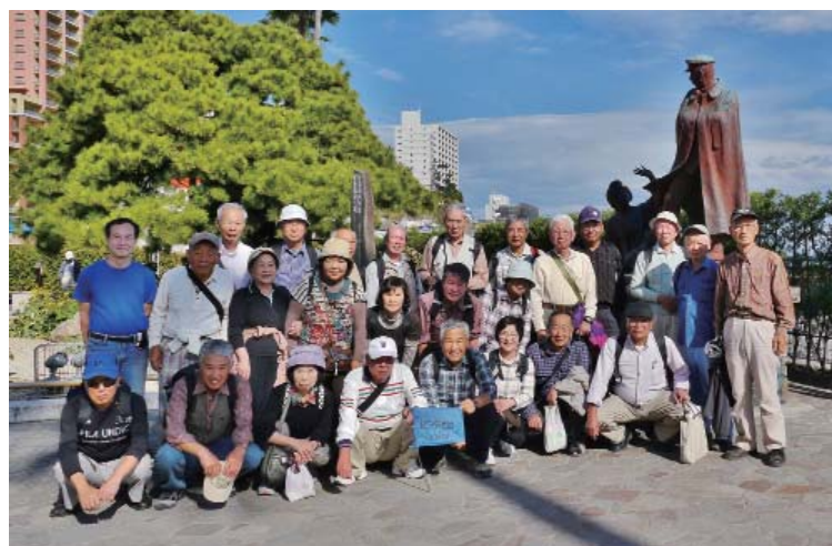
ゴールのお宮の松前で集合写真