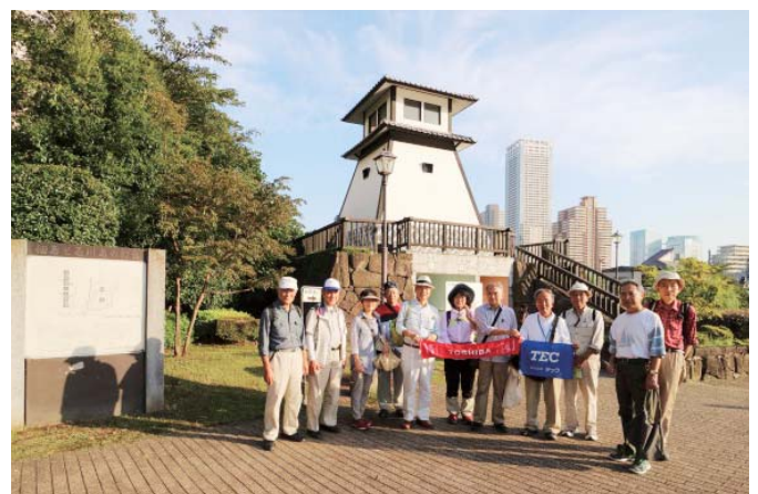
石川島人足寄場跡(石川島灯台)にて